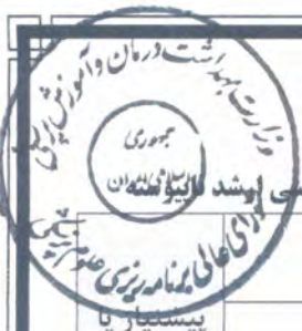
جدول ب: دروس اختصاصی اجباری (core) برنامه آموزشی رشته پرستاری مراقبت‌های ویژه نوزادان در مقطع کارشناسی ارشد الکترونیک